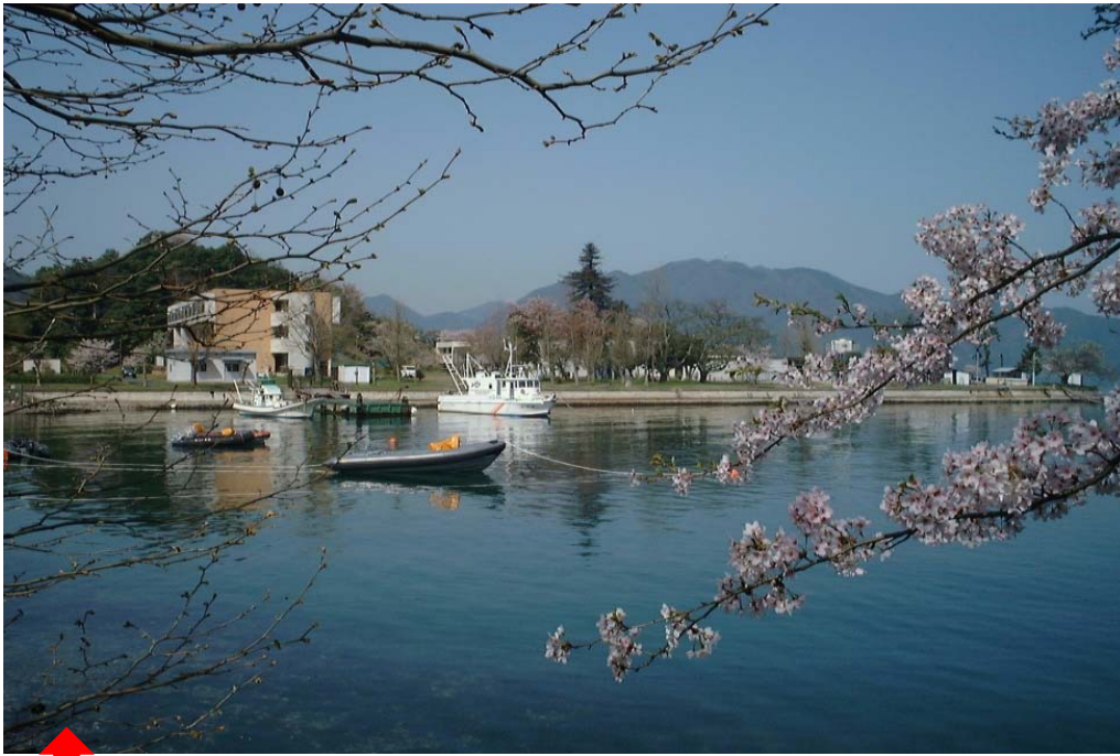
舞鶴水産実験所 潜水調査