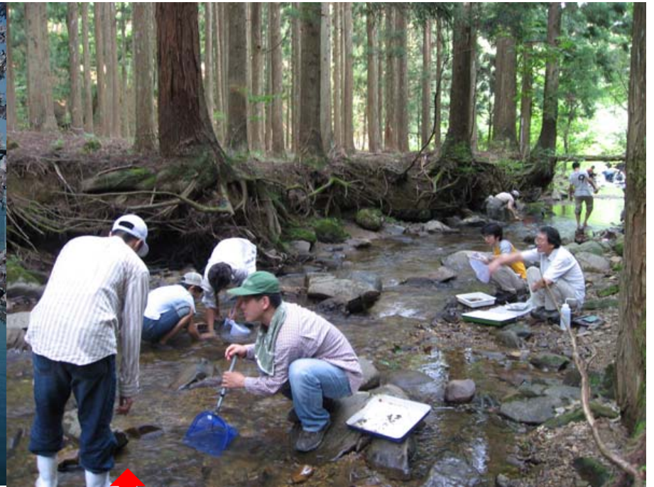
芦生研究林～由良川調査