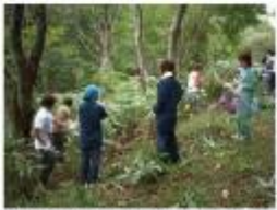
ボランティアによるササの刈取

藤織保存会の講習のほかに、藤づるや薪炭材の採取を通じて、里山の恵みから紡ぎだされる藤織に関心を持ってもらうような企画を考えていきたいと思っています。