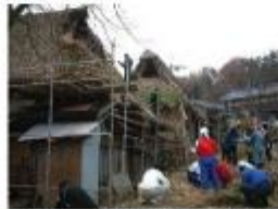
ボランティアによるササ葺き屋根の修復作業（京丹後市大宮町五十河）