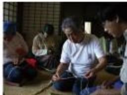
藤織の技術を伝承する活動