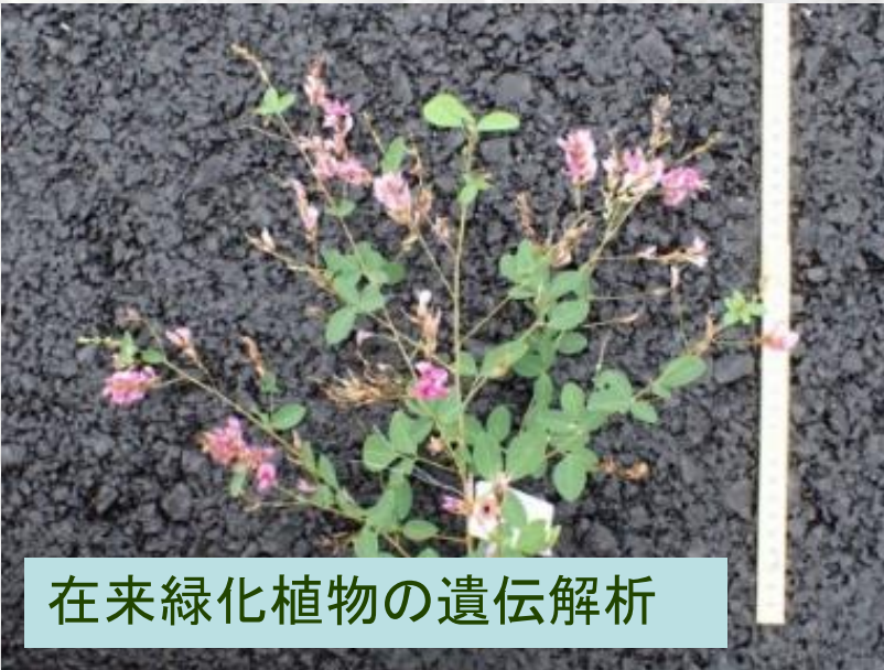
在来緑化植物の遺伝解析