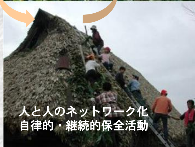
人と人のネットワーク化 自律的・継続的保全活動