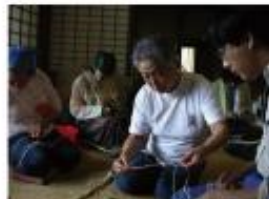
藤織の技術を伝承する活動