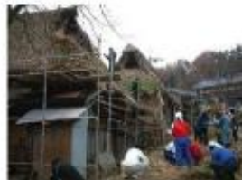
ボランティアによるササ葺き屋根の修復作業（京丹後市大宮町五十河）