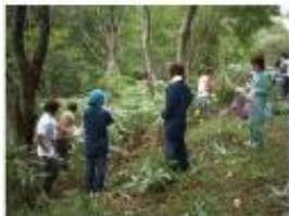
ボランティアによるササの刈取

藤織保存会の講習のほかに、藤づるや薪炭材の採取を通じて、里山の恵みから紡ぎだされる藤織に関心を持ってもらうような企画を考えていきたいと思っています。