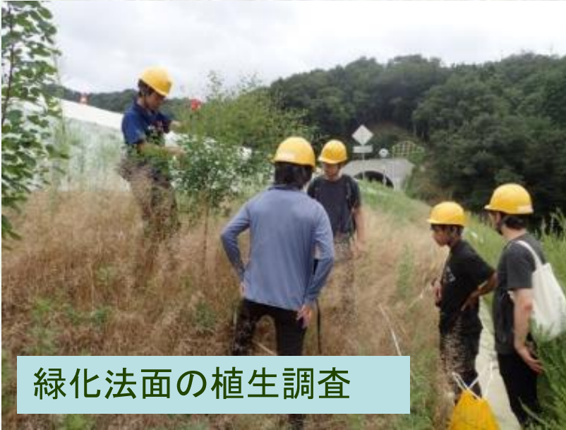
緑化法面の植生調査