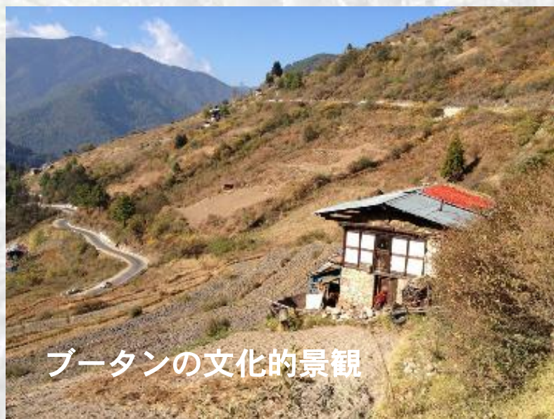
ブータンの文化的景観