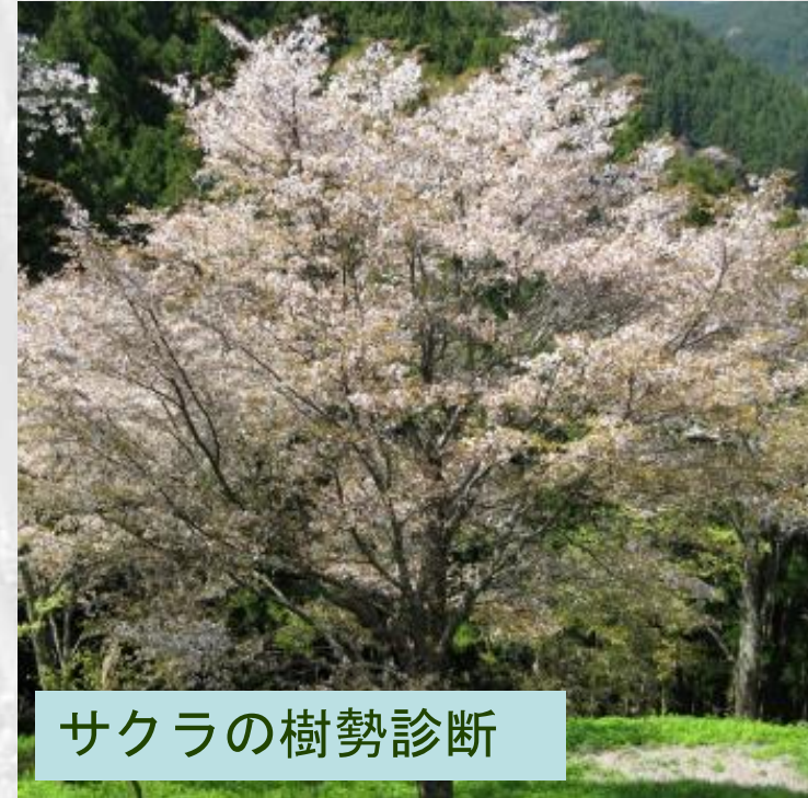
サクラの樹勢診断