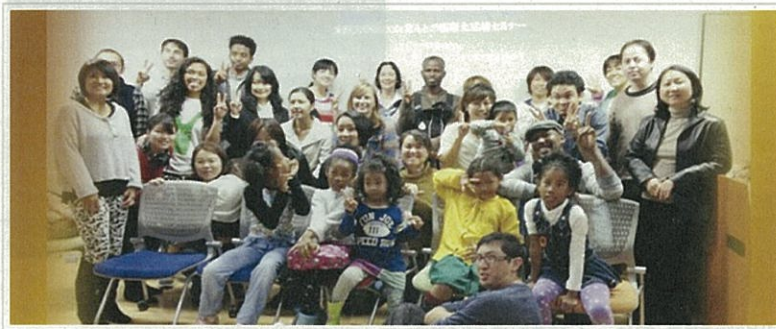
大阪大学で10月に行われたミックスルーツに関する討論会参加者

THE NORTH AMERICAN POST STAFF NOVEMBER 20 2012 0