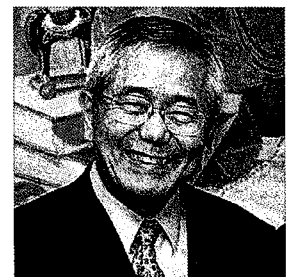
米パデュー大学 根岸 英一特別教授 （帝人グループ名誉フェロー） 帝人久村奨学生第5回生（1957年）

そして自らの「夢」を見つけたら真理を突き詰めるまで、とことんチャレンジしてください。今後の皆さんの大いなる活躍に期待しています。