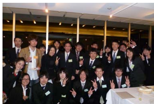
奨学生証授与式・懇親会