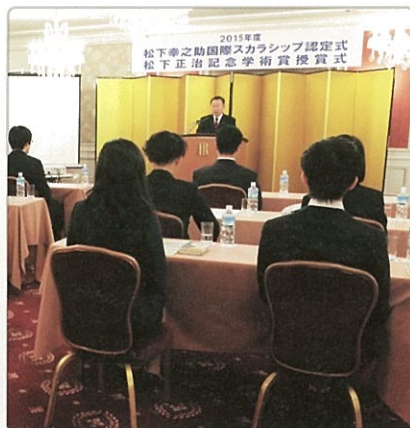
松下正治記念学術賞として出版