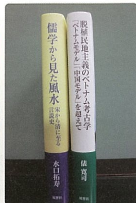
・2013年度: 侯 寛司氏 ・2014年度: 水口拓寿氏