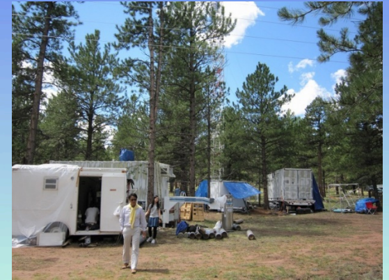
アメリカロッキー山脈での観測